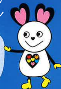
カルフルとちぎ応援隊長 ナイチュウ