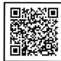
参加登録フォーム QRコード

・全国公的扶助研究会ホームページ・公的扶助研究会フェイスブック 参加登録はセミナー当日でも可能ですが、レジメのダウンロード方法などのお知らせメールを送付しますので早目の登録をお願いします。