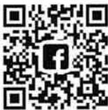
全国公的扶助研究会 facebook

現場から手づくりの機関誌、ぜひ手にとってお読みいただきたいと思います。 お問い合わせは全国公的扶助研究会 ( https://www.kofuken.com/ ) まで！