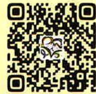
参加申込フォーム